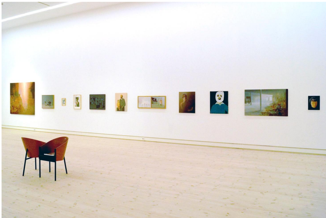
Nina Sten-Knudsen: Love, Fear and Evil . Installationsvue.