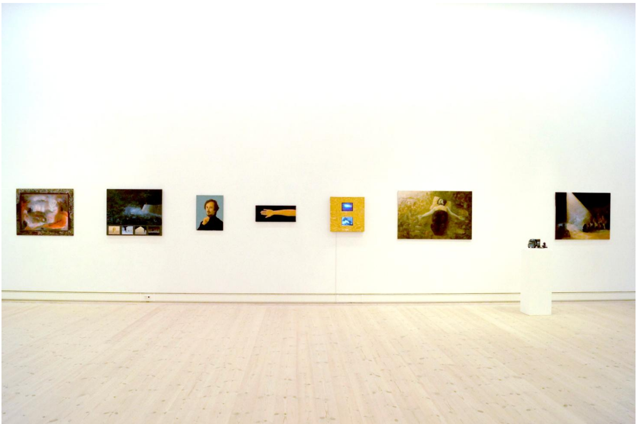
Nina Sten-Knudsen: Love, Fear and Evil . Installationsvue.