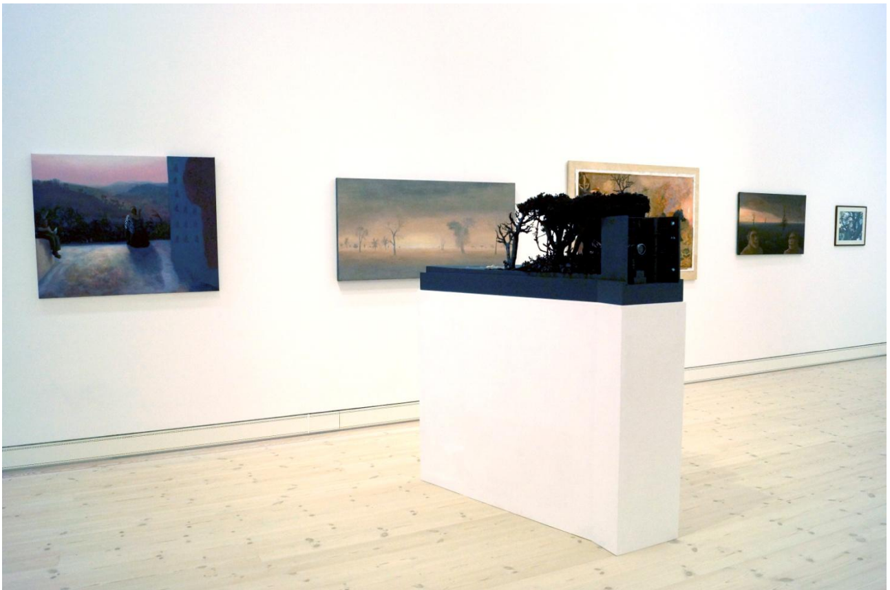
Nina Sten-Knudsen: Love, Fear and Evil . Installationsvue.